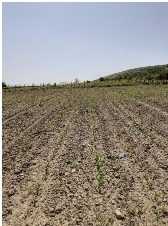
Fig. 1 – Aspecte ale amplasamentului care se va împăduri (31.05.2023)

Coordonatele Stereo 70 ale punctelor de contur pentru suprafața propusă la împădurire se prezintă în tabelul 2.